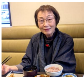
インプラント治療後、初の外食 トンカツ食べれました。