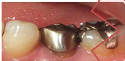
いままでの虫歯治療の被せものは銀色でした。