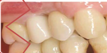
コストをかけずに天然歯に近い白い歯に

歯の治療できる回数は「おおよそ5回」と言われています。今何歳ですか?あと何年美味しく食事をしたいですか?歯に優しい治療法を選んでください。